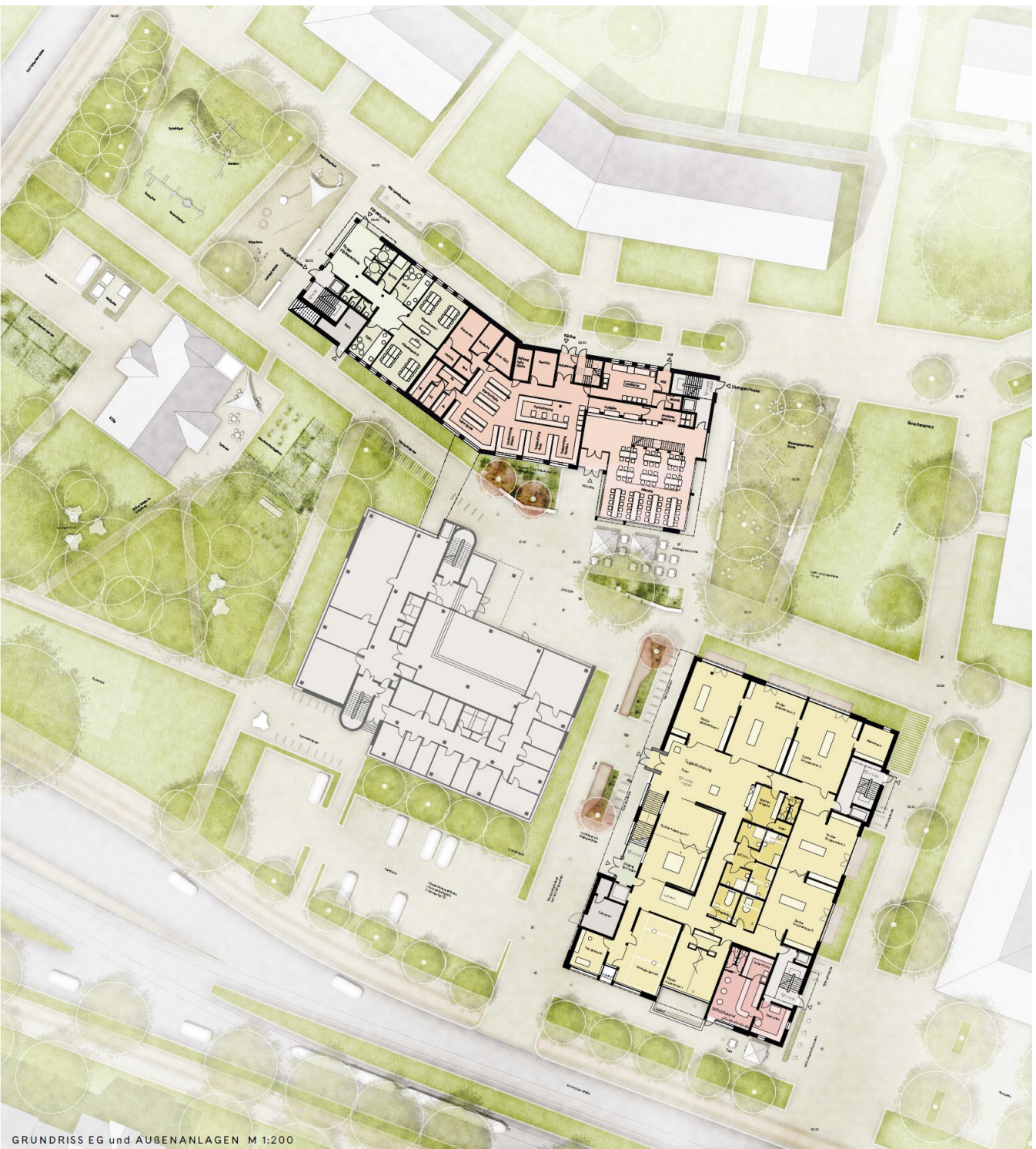
GRUNDRISS EG und AUBENANLAGEN M 1:200